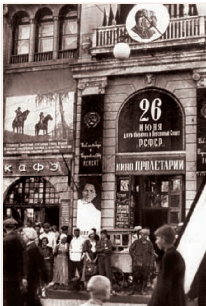
Кинотеатр «Пролетарий», бывший «Увечный воин», 1938 г.