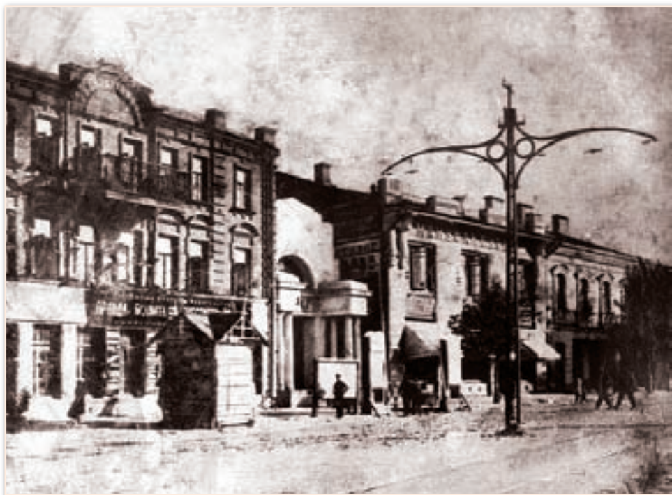
Кинотеатр «Ампир», 1920-е гг.