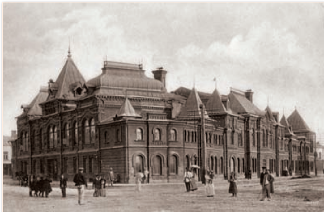
Здание городского зимнего театра, начало XX в.