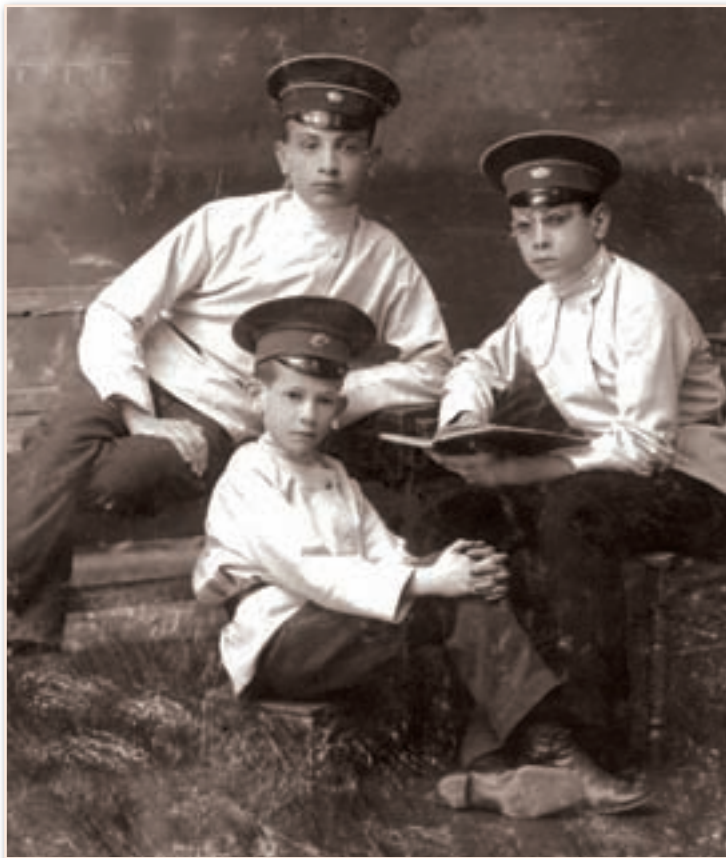
Ученики Воронежского реального училища, начало XX в.