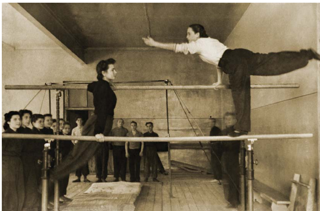
Занятия в гимнастическом зале. 1947 год