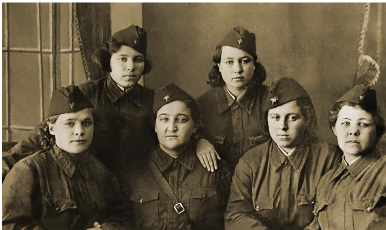
Студентки ВГУ перед отправкой на фронт. 1943 год