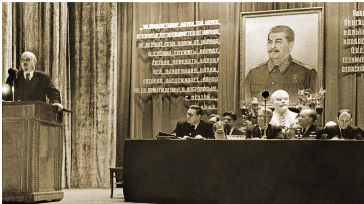
Научная дискуссия периода борьбы с космополитами. 1948 год