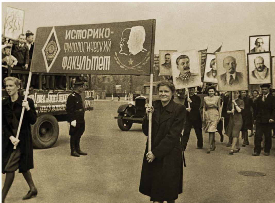
Историко-филологический факультет на Первомайской демонстрации. 1948 год