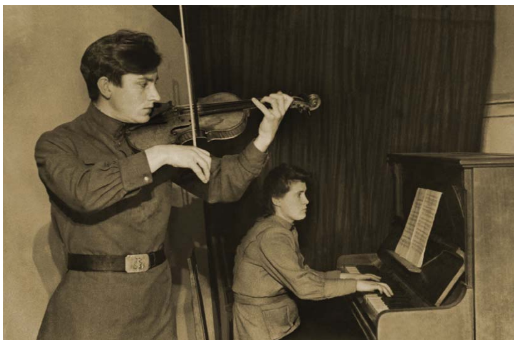
Идет городской смотр художественной самодеятельности. Выступают студенты ВГУ. 1948 год