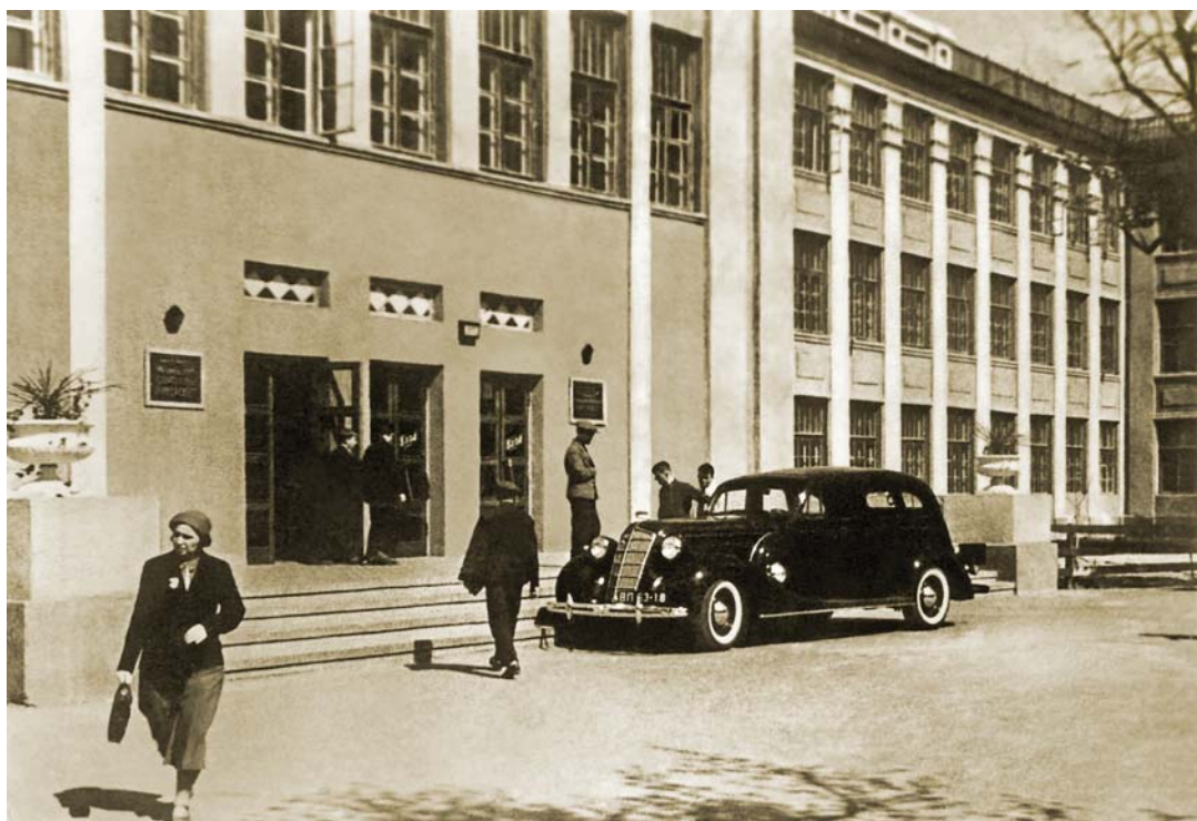
Новый корпус ВГУ. На переднем плане доцент физико-математического факультета Н.Е. Маркова. 1930-е годы