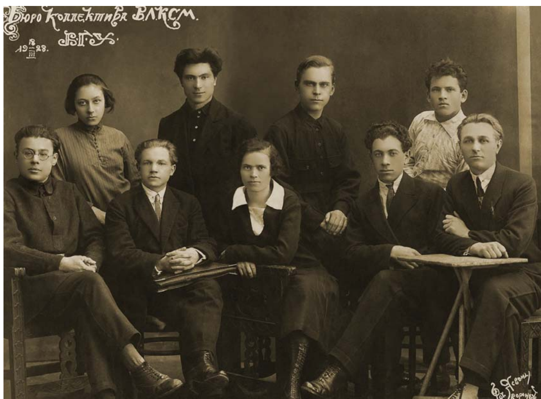
Грозное бюро университетского комсомола. 1928 год