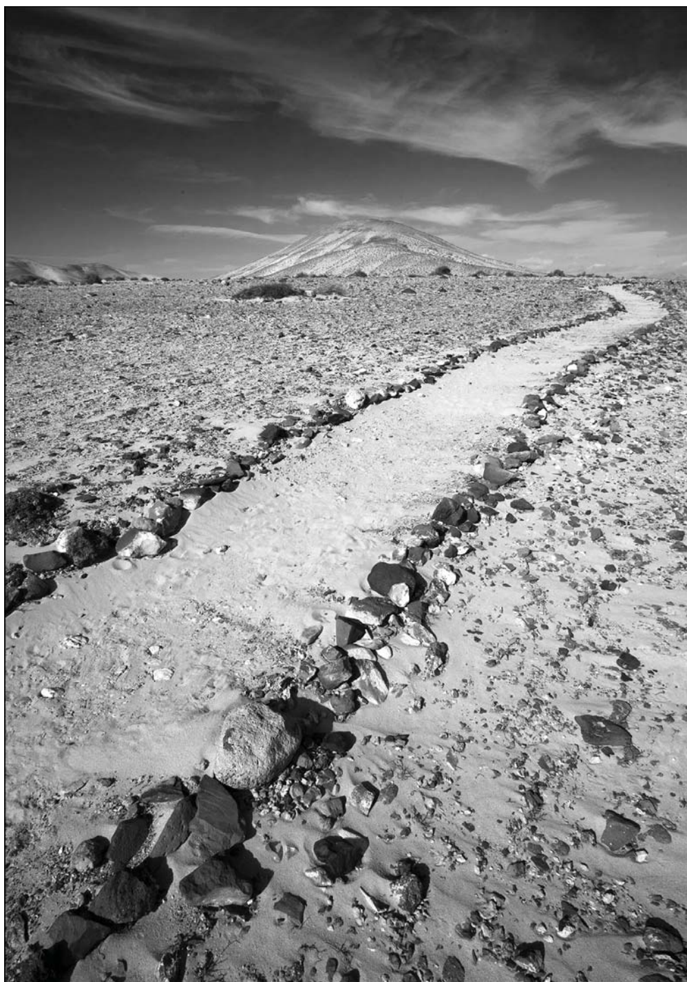
Константин Кириакиди. Канары