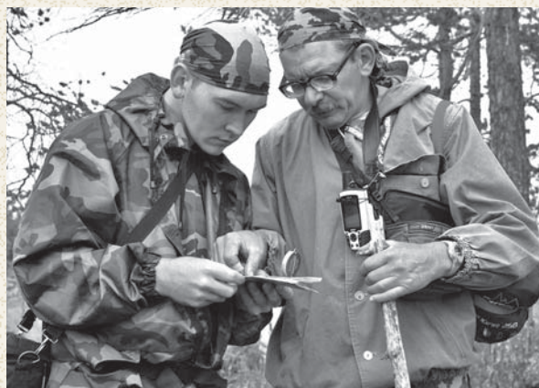
На маршруте – в поисках интересных кадров