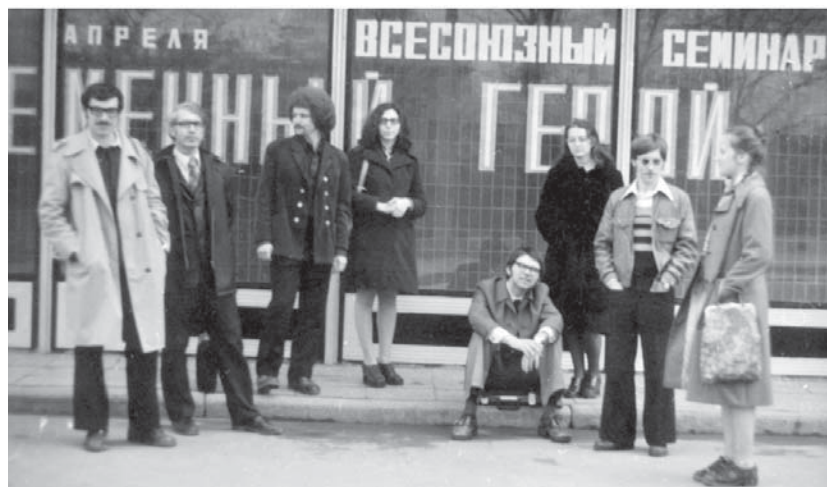
Делегация воронежского киноклуба в Харькове