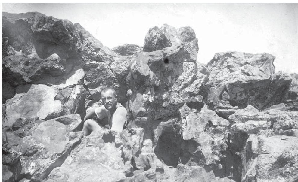
Пещеристый песчаник. 1927 год

Я говорил со своим компаньоном по комнате. Он здешний, хреновской житель. Бывший секретарь райкома, политрук завода. Он говорит, у них можно остановиться на этот срок. Да и вообще, здесь не проблема найти помещение. Санаторий ведь находится около села Хреновое, которое является районным центром. Домики здесь хорошие. Рядом с лесом.