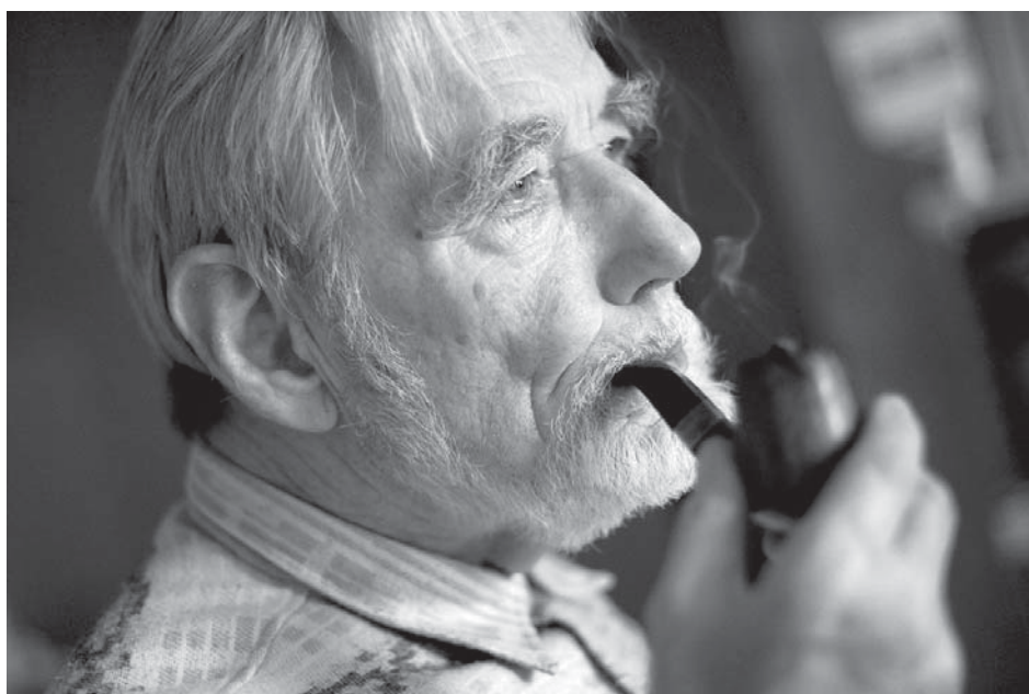
В. Бисениекс: вглядываясь в призрачный мир