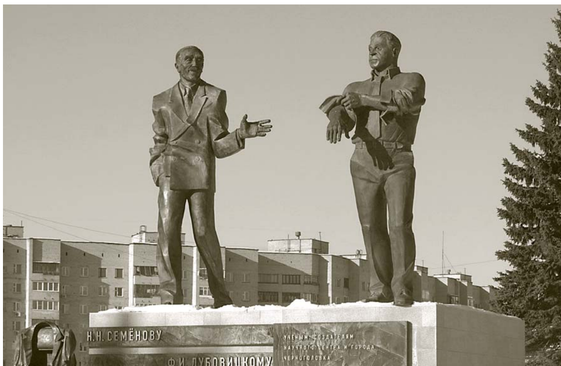
Монумент в Черноголовке стал самым большим в России памятником ученым

Федор Иванович Дубовицкий был талантливым ученым и уникальным организатором. В одной из своих автобиографий он писал: «Родился 20-го фев-