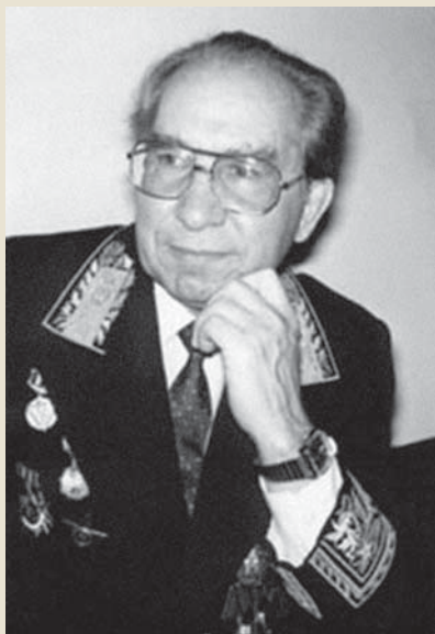
Чрезвычайный и полномочный посол СССР В. Г. Беляев

пакистанские ПВО могли запросто сбить советский самолет, который к тому времени уже приземлился в Ташкенте на дозаправку.