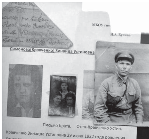
Фрагмент экспозиции выставки «Война. Победа. Память». 2015 год