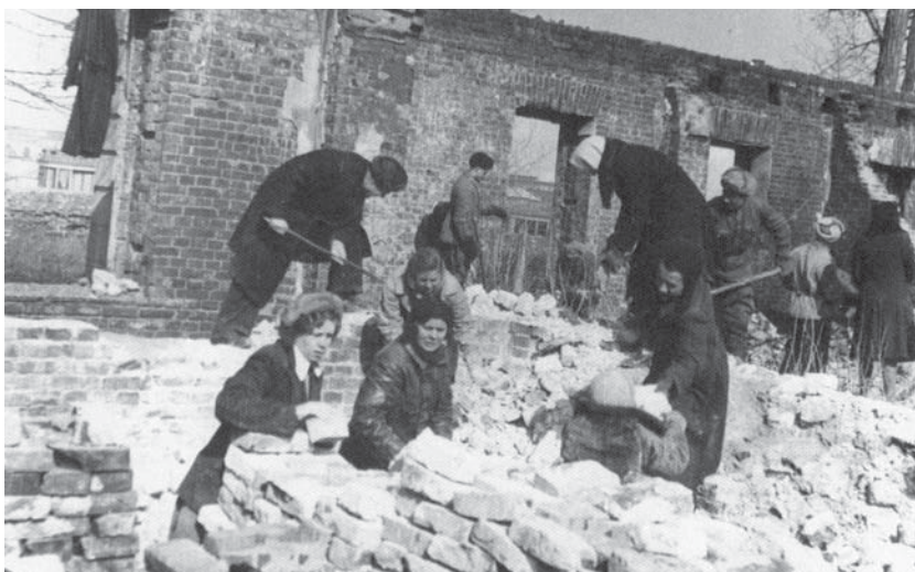
Студенты ВГУ на восстановительных работах. 1948 (?) год.

экспозиционное решение – часть выставки была оформлена в виде читального зала библиотеки – позволило посетителям не спеша, сидя за столами, изучать документы, статьи, фотографии и биографии, рассказывающие о событиях тех лет. Один из разделов выставки был посвящен знаменитому химику Георгию Николаевичу Флёрову.