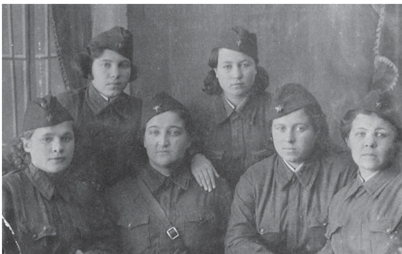
Студентки ВГУ на фронте. 1943 год.