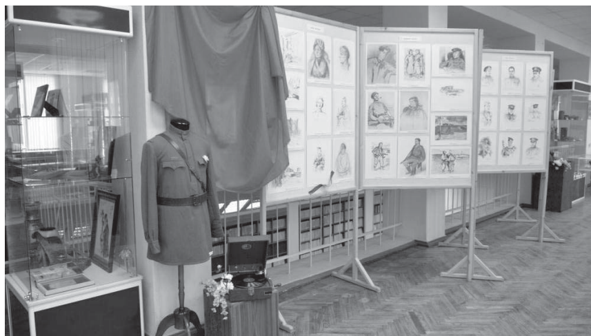
Экспозиция выставки «Война. Победа. Память». 2015 год