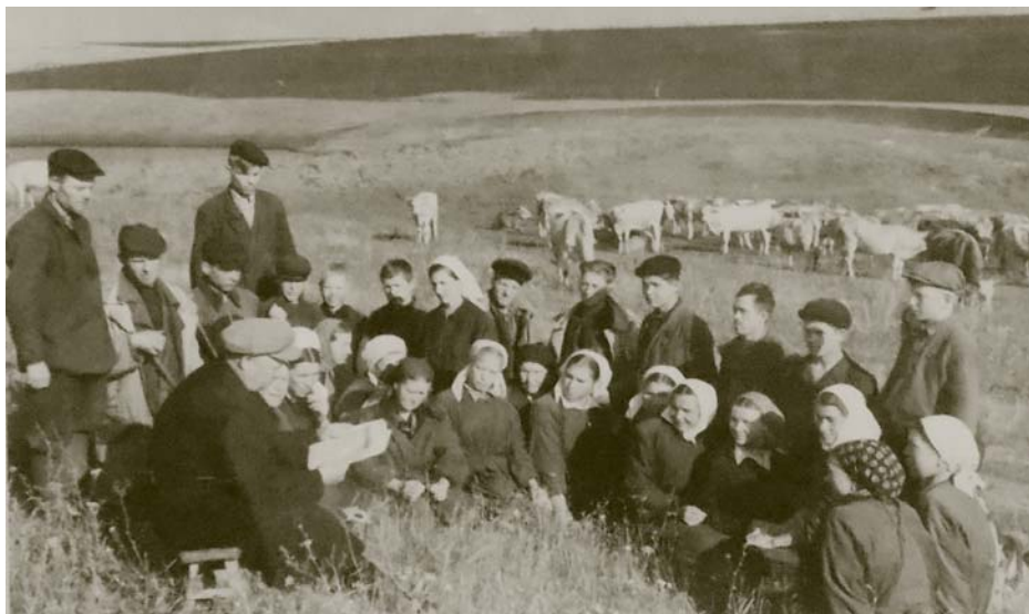
Изучение материалов XX съезда КПСС в колхозе имени Н. С. Хрущева Семилукского района Воронежской области. 1956 год